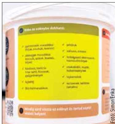
A konyhai zöld- és élelmiszer-hulladékot gyűjtő kukában sokféle szerves hulladék elhelyezhető

A konyhai zöld- és élelmiszer-hulladékot biogázüzemekben hasznosítják újra, így járulva hozzá a körforgásos gazdaság kiépítéséhez, hiszen megújuló energiaforrásként áramot és hőt állítanak elő belőle. A biogázüzemben képződő maradék ráadásul – magas tápanyagtartalma miatt – kiváló komposztanyagot képez a mezőgazdaság számára.