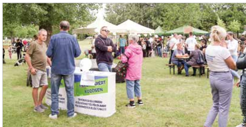
A nap folyamán gyerekprogramok várták a kapcsolódni vágyókat, az egyesület standjánál pedig támogató aláírásokat gyűjtöttek

Földi Judit hozzátette: szeretnék e mellett a gyermekek védőoltását támogatni a gyermekorvosok bevonásával. A polgármesterjelölt azt is elmondta, hogy van egy jótanulópogramtervük: ha lakai 4,8-es átlag felett teljesít az iskolában, azt megjutalmazná a város, jelezve, mennyire büszkéek rá.