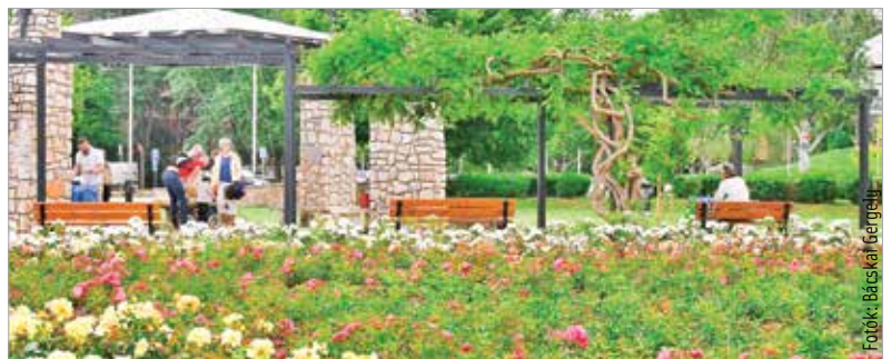
A park és a Csitány-kút minden időben kedvelt helye a fehérváriaknak

Hatezer rózsátó virágzik a megújított Rózsaligetben. Mindegyik ágyásba más színű rózsát ültettek a kertészek. A két legnagyobb, négyszáz-négyszáz négyzetméteres ágyásba egyenként ezerhatszáz fő növény került, melyeknek befelé változik a magassága.