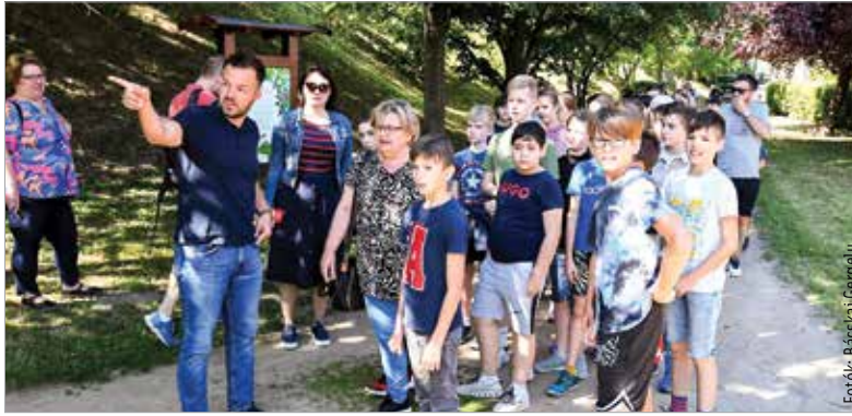
A több mint négyhektáros, a ráchegi Apatini utcából nyíló régi bányagödör az 1900-as évek elején nyerte el mai formáját