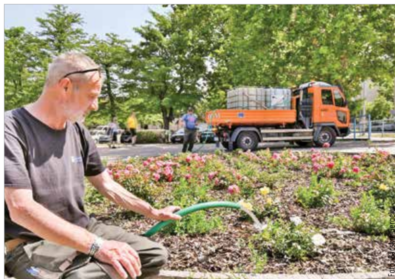
A Városgondnokság arra kéri a fehérváriakat, hogy aki teheti, a lakókörnyezetében öntözze meg időnként a közterületen lévő növényeket, hiszen meghálálják!

Öntözik a villanyoszlopokon található virágokat, a belvárosban a virágoszlopokat és a dézsás növényeket, töltik a mintegy ezeröttszáz öntözőzsákot a fiatal fáknál, illetve az egyházi és az évelő virágok ágyáit is locsolják.