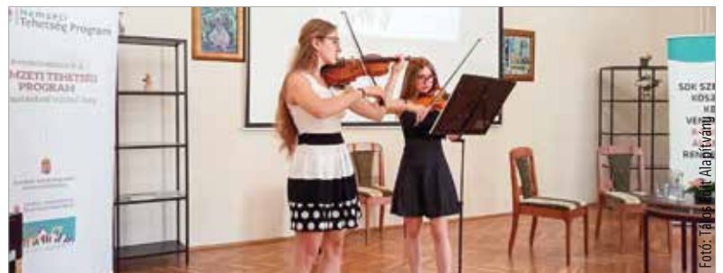
A művészeti nevelés melletti elköteleződés értő figyelmet, fegyelmet, kitartást kíván szülőktől, gyermektől egyaránt