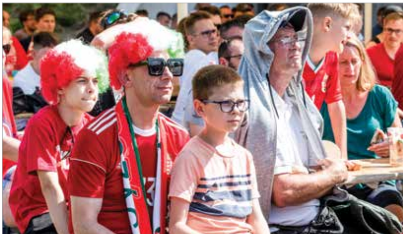
A meccsnézés akkor is családi program, ha a mérkőzést éppen száz kilométerre rendezik