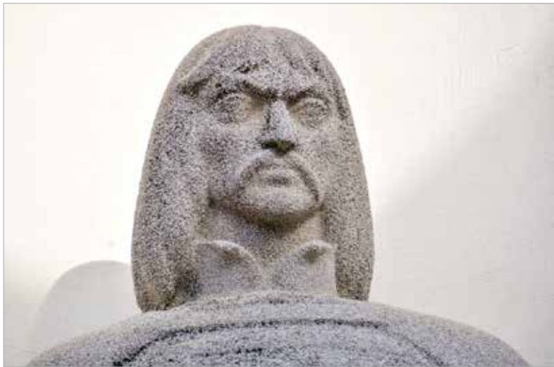
Okna van, hogy bár Zrínyi Miklóst ábrázolja, mégsem az ő nevét viseli a szobor