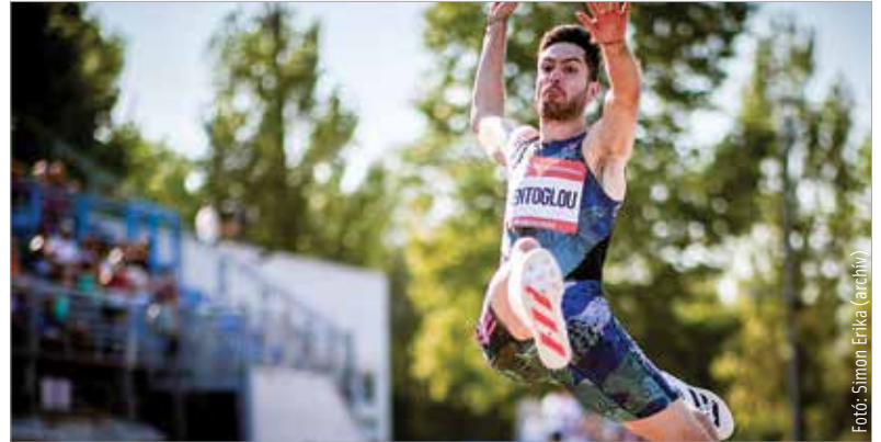
Tentoglut láthattuk már messzire ugrani a Bregyóban

madik Carey McLeod is nevezett. Hasonlóan izgalmas versenyt hozhat a díszkoszvetés: a verseny során a 74,35 méterrel világcúcs-tartó Alekna mellett dobókörbe lép a 2022-es világbajnok szlovén Kristjan Ceh – aki akkor a szám legfiatalabb vb-győztese lett – valamint a legutóbbi olimpián aranyérmes svéd Daniel Stahl is. Súlylökésben két világklasszis csaphat össze, ugyanis a szintén Rómában diadalmaskodó Fabbri és a 2017-ben Londonban vb-címet nyert új-zélandi Tom Walsh is itt lesz Székesfehérváron. A Gyulai Memorialt ezúttal is a Bregyó közti Atlétikai Centrumban rendezik.