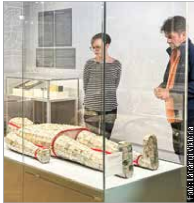
Csőre Gábor színművész a Múzeumok éjszakája idején a nagykövete

Másfél évtized alatt közel harminc szervezet és intézmény vett részt a szervezésben – hangzott el a fehérvári eseményeket bemutató múlt pénteki sajtótájékoztatón. A Székesfehérvár önkormányzata támogatásával megvalósult programok eddig több mint ötvenötezer látogató részvételével maradandó kulturális élményben. A szervezők közötti összefogás országosan példaértékű, így a város joggal érdemelte ki, hogy a Kulturális és Innovációs Minisztériumtól ebben az esztendőben megkapja a Múzeumok Éjszakája Kiemelt Helyszíne címet. Cser-Palkovics András kiemelte: a város büszke arra, hogy a kulturális intézmények, szervezetek a kezdetektől fogva közreműködnek a Múzeumok éjszakája megvalósításában. A polgármester szerint megtisztelő, hogy idén kiemelt helyszíne a rendezvénynek Székesfehérvár, amiben partnere testvérvárosa, Esztergom. Az esemény idei tematikája a labdarúgó Európa-bajnoksághoz kapcsolódva a gólpassz, ami megerősíti, hogy a kultúrának és a sportnak kulcsszerepe van a közösség szervezésében. Hagyomány Székesfehérváron, hogy a karszalagok árából befolyt összeg-