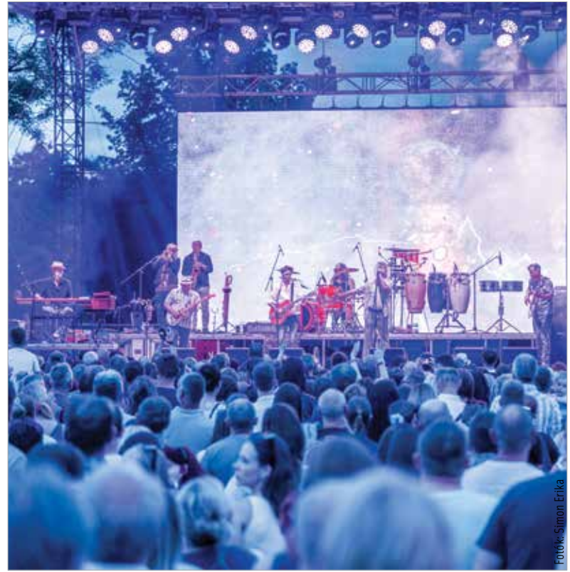
Több ezer fehérvári Quimby-rajongó álma teljesült a szombati ingyenes koncerttel