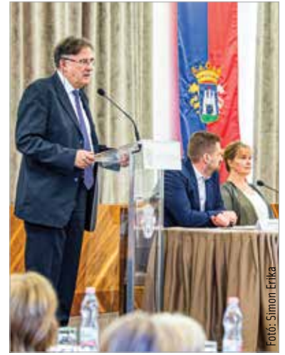
Komoly internetes támadások áldozatai is lehetünk, ezért a konferencia idén a kiberbiztonságot célozta meg