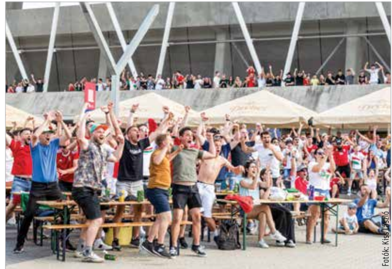
A szombati magyar gól pillanata: az eufória olyan, mintha a stadionban ünnepelnének a szurkolók

csén, de hiába voltak helyzetei az első félidőben, a végén érvényesült a németek erőfölénye. 2-0-ra nyertek, így Szoboszlaiék két forduló után pont nélkül állnak.