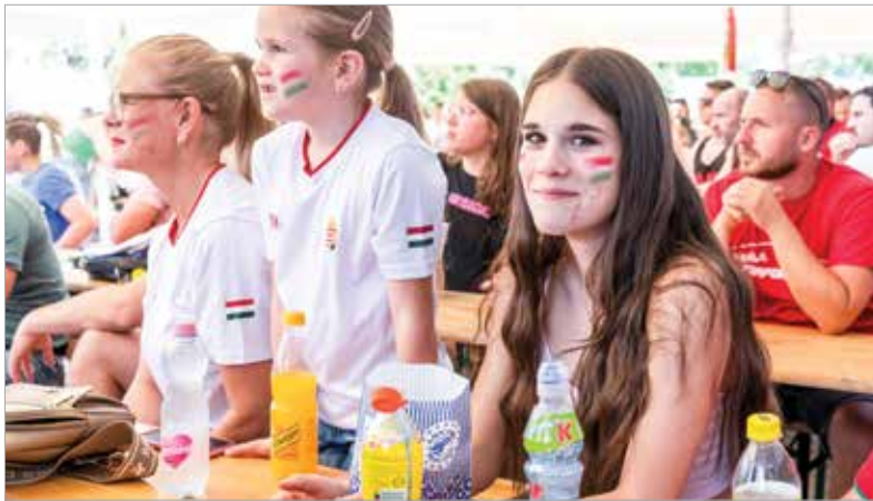
Méghogy a foci csak a férfiakat érdekli!

jutottak el Németországba, itthon használják ki, hogy közösen szurkolhatnak a mieinknek. Sajnos a nyitányon Svájc ellen csak a szurkolás öröme jutott, az eredmény miatt senki nem volt boldog (1-2). Szerda este aztán a házigazda németek ellen megint kieresztették hangjukat a magyar szurkolók – Fehérváron is. A magyar válogatott jobban játszott, mint az első meccs-