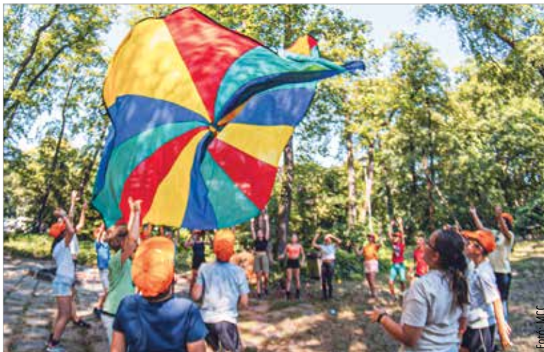
Megannyi kaland, kihívás és közösségi élmény várja a diákokat

A felvételi a következő tanév elején lesz, itt a diákok motivációját, nyitottságát, elhivatottságát, intelligenciáját vizsgálják majd.