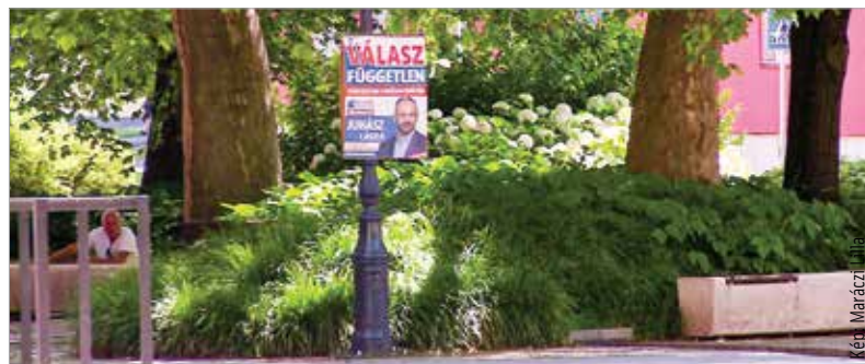
A választások után harminc nappal már nem lehetnek kint a plakátok

molinókat a szavazást követően a pártoknak, szervezeteknek maguknak kell eltávolítani, erre harminc napjuk van. A választási plakátokat minden esetben károkozás nélkül kell leszedniük. Ha az eltávolítás közben lámpaoszlopok vagy villanypóznák mégis megsérülnek, a helyreállítás költségeit nekik kell fizetniük. Amennyiben az eltávolítás nem történik meg július kilencedikéig, akkor a plakátokat a jelöltek, jelölőszervezetek helyett a Városgondnokság munkatársai távolítják el. Ebben az esetben azonban a költségeket az érdekelteknek kiszámlázzák.