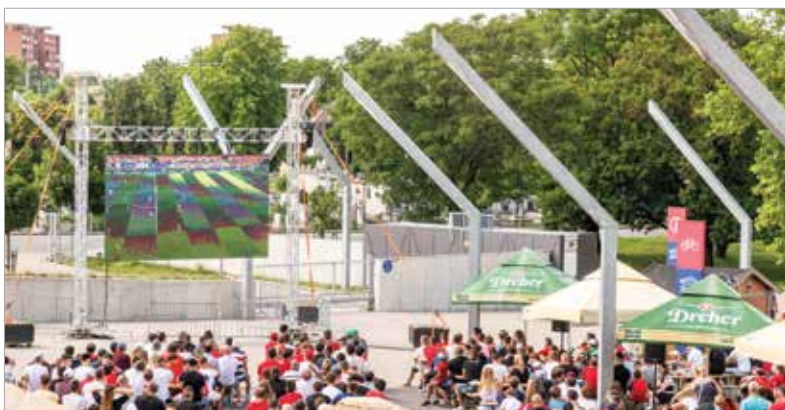
A hőség és a távolság sem számít, amikor egy Európa-bajnokságon lehet a magyaroknak szurkolni!