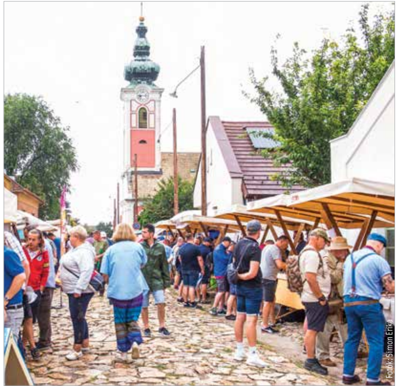
A Rác utca idén is megtelt kiállítókkal és látogatókkal

alkalmából hirdett Fém a fém-című pályázatra beérkezett alkotásokból nyílt a Rác utca 13. szám alatti portán. A pályamunkákat Takáts Zoltán, a Magyarországi Kovácsmíves Céh atyamestere értékelte. A szakmai zsűri döntése