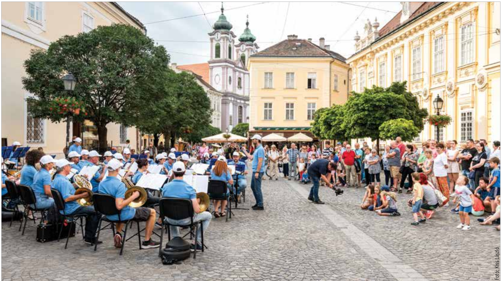
Lendületes dallamokkal szórakoztatta közönségét a fúvószenekar