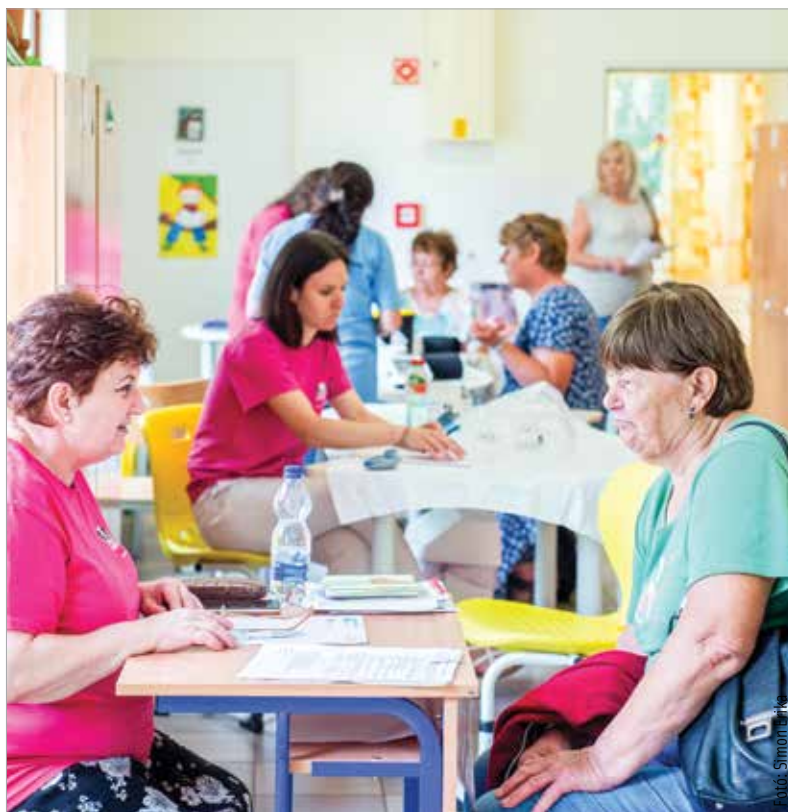
Feketehegy-Szárazréten folytatódott szombaton a városrészi szűrőnapok sorozata. A Székesfehérvári Egészségfejlesztési Iroda és az önkormányzat közös egészségmegőrző eseménye iránt ezúttal is nagy volt az érdeklődés. A városrészen élők ingyenes EKG-, kardiológiai, boka-kar index- és COPD-vizsgálaton, valamint általános állapotfelmérésen vehettek részt.