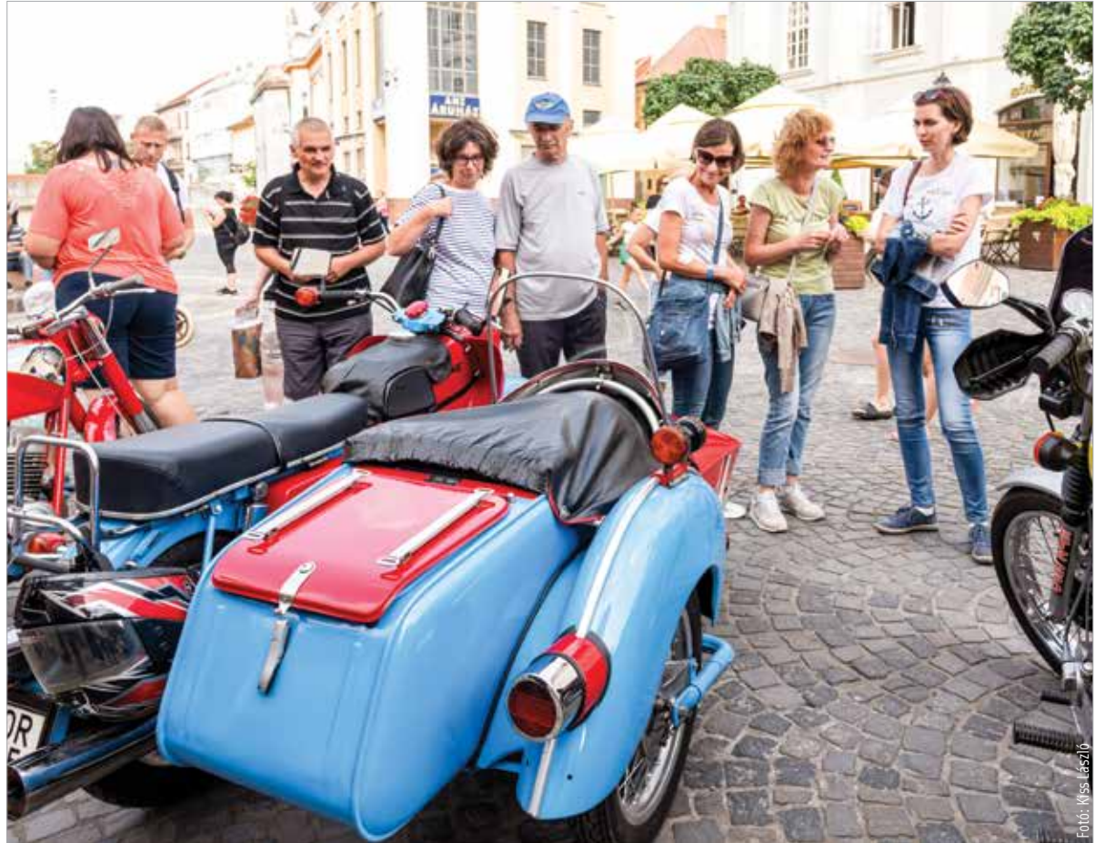
Régi járműveket is megcsodálhattak a járókelők a Városháza előtt

Az országos programot immár huszonkettedik alkalommal szervezték meg: négyszázhatvan helyszínen mintegy kétezer-nyolcszáz program várta az érdeklődőket.