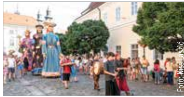
Idén is benépesül a belváros az Országalmától a Zichy ligetig

A Királyok a belvárosban elnevezésű sorozat évek óta nagyon népszerű, a szombati programokon minden alkalommal népes közönség gyűlik össze, hogy találkozzon a királyióriásbáb-család tagjaival, akik hétvégente