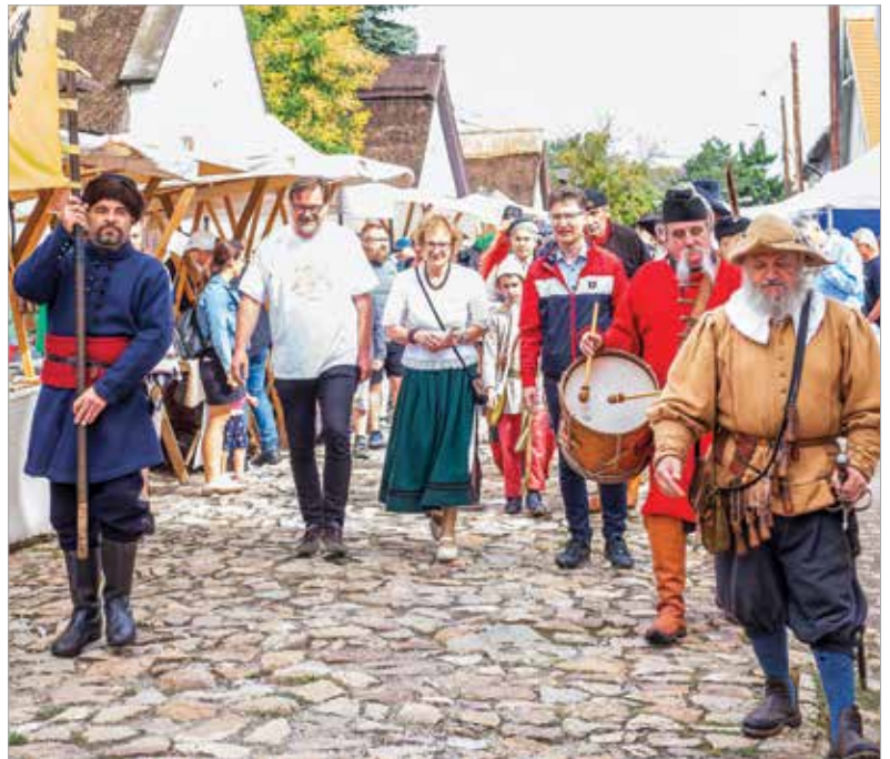
A fesztiválról nem hiányozhattak a hagyományörzők sem!

hadtak a legendák sem, akiknek munkái a funkcionalitás, a kidolgozottság mellett igazi művészeti élményt nyújtanak. A fesztivál a családoknak is kiváló kikapcsolódási lehetőséget jelentett. Népi játékok várták a