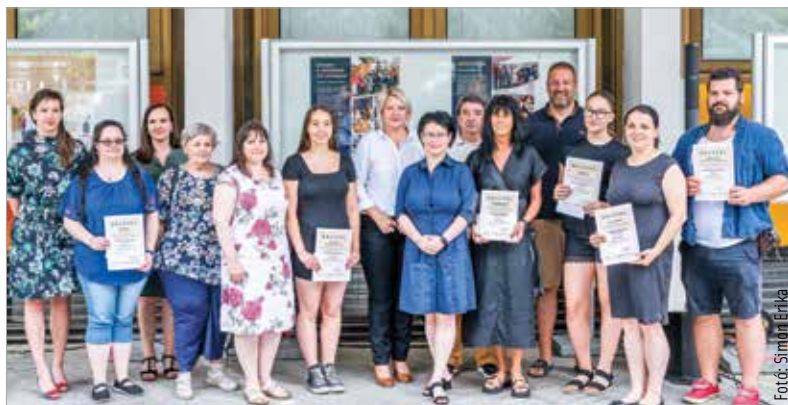
A tablókiallítás, mely az önkéntességre szeretné felhívni a figyelmet, július huszonötödikéig tekinthető meg

A kiállításmegnyitón elhangzott, hogy a civilszervezetek a vakáció alatt sem pihennek: programjaikról a Fejér Vármegyei Civil Közösségi Szolgáltatóközpont közösségi oldalán találhatunk részleteket.