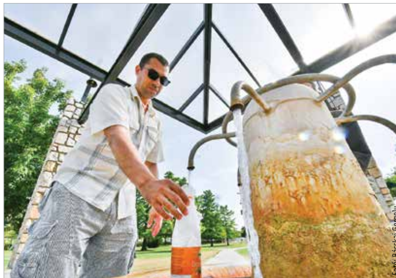
Hőség idején kiemelten fontos a megfelelő mennyiségű folyadék fogyasztása

A város polgármestere mindenkit arra kér, hogy figyeljünk egymásra, kiemelten a környezetünkben élő idősek, valamint vigyázzunk a háziállatainkra is! „A hóhullám hatásainak