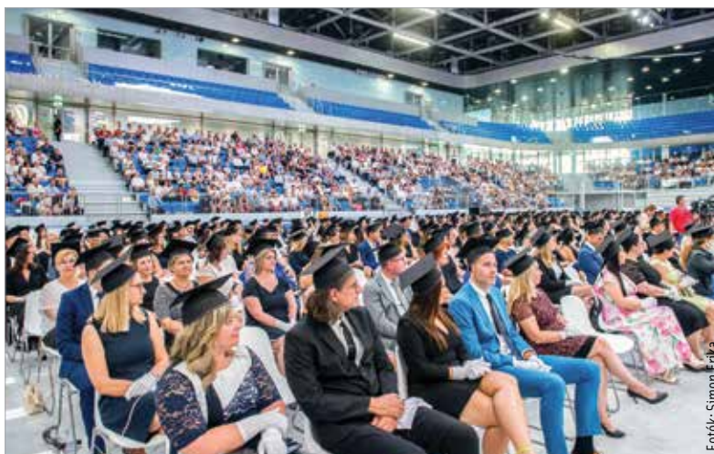
Ünnepélyes keretek között, az Alba Arénában vehették át diplomájukat a Kodolányi végzősei