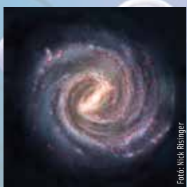
2024. júl. 18-24.

Szeretnél szabadságra menni, de egy darabig ennek esélyét sem látod. Hamarosan azonban változik a helyzet. Óriási cselekvési vágyat érzel, és a fáradság érzése is elmúlik. Minden a saját elhatározásodból és az elképzeléseid szerint történik, és a párkapcsolatodban is remek időszak vár rád!