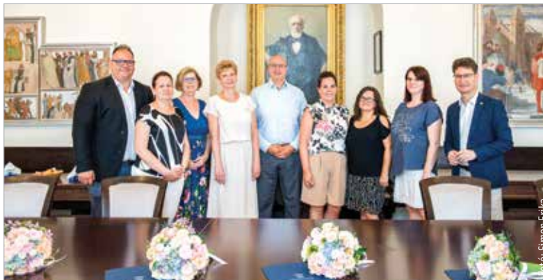
Korábbi szép hagyomány folytatása volt a találkozó

„Székesfehérváron kiterjedt és erős az intézményhálózat, amelynek működtetése és működése a közös munkán alapul. Van ebben sok jó, egyéni teljesítmény a vezetők részéről, és tudjuk, hogy emögött mindig ott áll a kollégákkal való együttműködésen alapuló csapatmunka. Ezúton is szeretném ezért köszönetet mondani