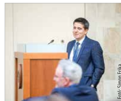
A megbízási díszokiratot szerdán vette át az új főigazgató

2015-től a Fejér Vármegyei Szent György Egyetemi Oktató Kórház Traumatológiai Osztályán dolgozik. A magas színvonalú szakmai munka és emberi környezet a továbbiakban már Székesfehérvárhoz köti. 2017-ben kezdeményező szerepet vállalt a Baleseti Ambulan-