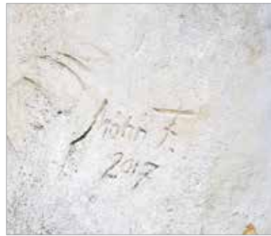
Az alkotó szignója