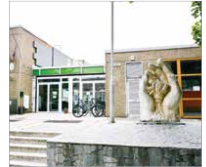
Az iskola 35. születésnapjára készült Máhr Ferenc alkotása

Az ünnepélyes átadás több mint hatszáz gyerek előtt zajlott, szerencsére a művet azóta is nagy megbecsülés övezi a tanintézményben. Fontos, hogy régi, akár évszázados alkotásaink mellett az újat, a mai művészek által készített értékeket is megbecsüljük, ebben követendő példa lehet Máhr Ferenc szobrának története.