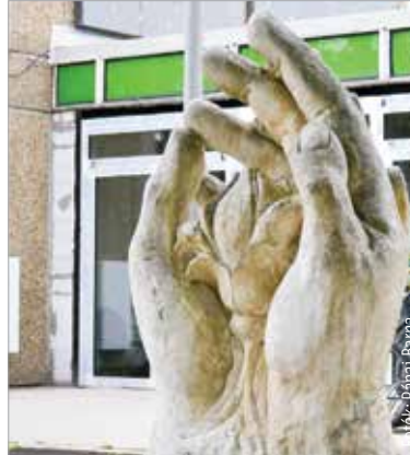
Az Óvó kezek alkotás mészköből készült

„A szobor története két éve kezdődött, egy viharos napon, amikor az iskola