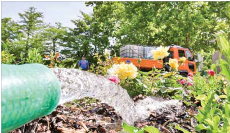
Az uszoda melletti nagy kapacitású kútból töltik a víztartályokat, amelyekből öntözik a virágokat

az évelő virágok ágyásait is locsolják. Több mint húszan dolgoznak felváltva azon, hogy a hőségben öntözzék a fákat és a virágokat Fehérvár közterületein. Mindegyik autón egy sofőr és egy öntözőember dolgozik, aki a tömlőre és a szivattyúra figyel. Idén diákok is segítenek a közterületi növények locsolásában, akik a Városgondnokságon dolgoznak a nyár folyamán.