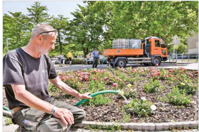
Városszerte folyamatos a növények öntözése

A cég öt kisteherautóján egy-egy darab egy köbméteres tartály található, és négy olyan nagyobb autó dolgozik, amin kettő, illetve három köbméteres tartály van, továbbá a nagy ötezer literes öntözőautó is folyamatosan dolgozik. Székesfehérvár Városgondnoksága az uszoda mellett rendelkezik egy nagy