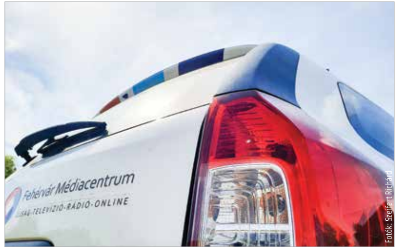
Mi magunk is ellenőrizhetjük az ablakmosó- és az olajsínt, ránézhetünk a gumik állapotára, és a légkondicionáló megfelelő működését is kipróbálhatjuk

annyit vigyünk, amennyire feltétlenül szükség van! Minél kevésbé terheljük a kocsit, annál kevesebb üzemanyaggal beéri útközben. Indulás előtt mindenképpen szellőztessük át a járművet, sőt a klímát is bekapcsolhatjuk az indulás előtti utolsó percekre. Ne legyen jégverem az autóban, mert könnyen megfázhatnak az utasok, arról nem is beszélve, hogy a nagy hőmérsékletkülönbség kiszálláskor meglepetést okozhat akár a fiatal szervezetnek is. Éppen ezért ajánlott kikapcsolni a légkondicionálót pár perccel azelőtt, hogy megállnánk. Ez jól tesz az autó hűtőrendszerének is, mert a