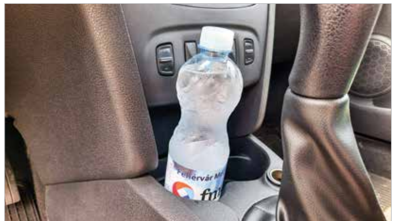
Melegben fontos a folyadékpótlás, legyen bekészítve innivaló minden utazáshoz!

nézhetünk a gumik állapotára, és a légkondicionáló megfelelő működését is kipróbálhatjuk. Elég, ha a rostélyokra tesszük a kezünket: ha megfelelően hűt a szerkezet, akkor kellemes hideget érzünk a bőrünkön. Ellenkező esetben forduljunk szakemberhez! Ne a régi, ablakleengedős módszer legyen az egyetlen hűtési lehetőségünk! Bár ezt a legnehezebb betartani, de a magas UV-sugárzású időszakot utazáskor érdemes lenne elkerülni. Autót és embert is próbáló időben mindenki rosszabbul teljesít. Legyünk tehát megfontoltak és előrettekintők a nyári autózás közben is!