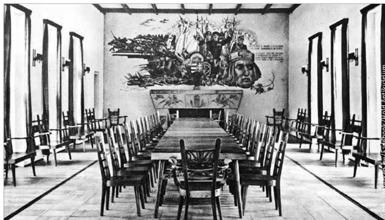
Ilyen volt egykor a nagyterem a falfestménnyel

Édesapja a cseh-magyar származású Novák Gyula vasútmérnök, édesanyja a bécsi születésű Waginger Róza volt. 1912 és 1914 között a budapesti Képzőművészeti Főiskolán tanult, majd dolgozott a szolnoki művésztelepen és Nagybányán. 1928-tól két éven át a Római Magyar Akadémia ösztöndíjasa, 1939-től a budapesti Képzőművészeti Főiskola tanára. A római iskola legdinamikusabb, legtermékenyebb alkotója volt a két világháború közötti Magyarországon.