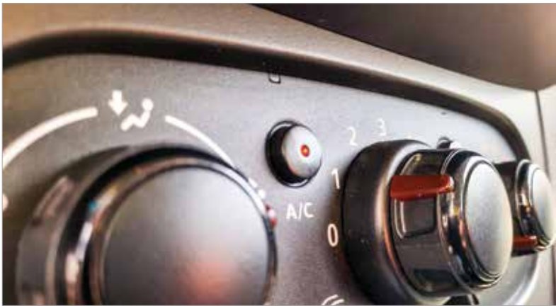
A klíma hasznos a melegben, de ne vigyük túlzásba a hűtést!

Először is fontos, hogy az út megtervezésekor vegyük figyelembe, hányan utazunk, és kinek milyen problémái lehetnek! Hányás elleni gyógyszer, rosszulletet megelőző nyalóka – a vegyszerek már sok olyan dolgot készítettek gyerekeknek is, melyekkel kiküszöbölhető az émelygés, és nem kell minden tizedik kilométer után megállni levegőzni. Csomagokból is lehetőség szerint