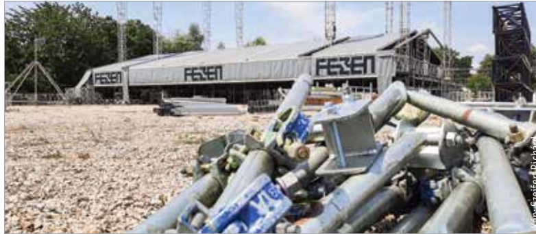
A nyitónapon, július harmincegyedikén többek között a Cradle of Filth, az Ossian, a Parno Graszt, a Carlon Coma és a Bëlga is fellép

A szervezők szeretnék, hogy a hangsúly a zenén legyen, ne a gyaloglás, ezért a színpadok között kisebb lesz a távolság. Idén is kiemelt szempont, hogy a