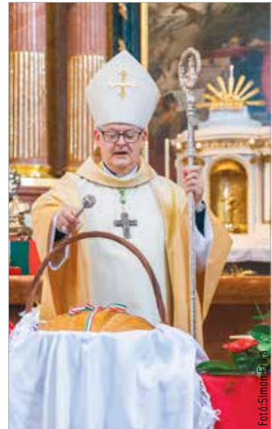
A kenyér az életet, a megélhetést és az otthon szimbolizálja. Az ünnepi szentmise végén Spányi Antal Isten áldását kérte valamennyi magyar család kenyérére és életére.

Szent István személyiségének, közösségformáló erejének köszönhető, hogy a magyar nemzet országgá, néppé tudott formálódni. Embersége példát mutat mindannyiunk számára. Államalapító királyunk rendíthetetlen, szilárd ember volt – ezekkel a gondolatokkal kezdte szentbeszédét Spányi Antal megyés püspök az ünnepi szentmisén: „Példája a férfi jellemnek, egyenes és korrekt. Megbízonyosodik az igazságról, és attól nem tántorodik el. Nem csábul el semmiféle kísértésre, emberi okosságának látszó tünemény műlő ígéreiteire. A feladat félelmetes nagyságának súlyát látva nem tántorodik meg, áll rendületlenül a helyén, ahová Isten rendelte. Nem kis teher volt a vállán. Sokszor valóban az élet és a halál mezsgyéjére került népe, országa. Sokszor volt nehéz helyzetben a belső villongások miatt, sokszor kellett a saját, a múltat folytatni és a jövőt kockáztatni akaró családja tagjaival is szembeállnia. De tudta, mi a kötelessége!” A püspök hozzátette: Szent István