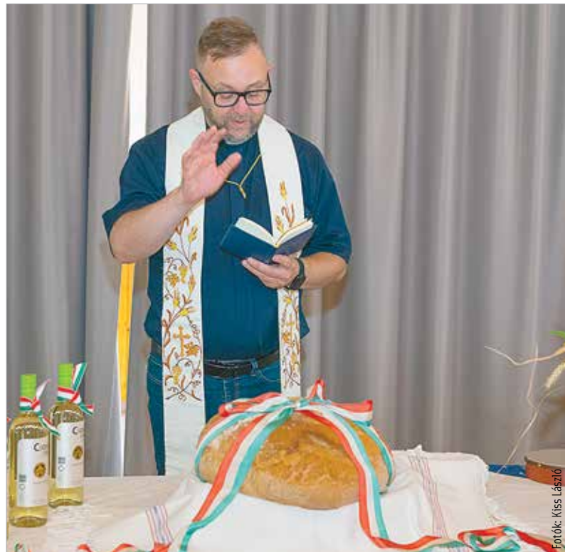
Régi hagyomány, hogy Kisfalud lakosai közösen emlékeznek meg az államalapításról, és osztják meg egymással a felszentelt, új kenyéret