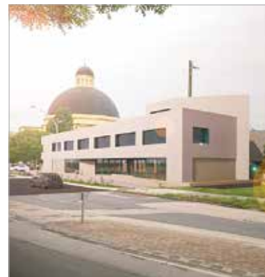
Az iskola egy teljesen új épülettel is bővül

A 2024/25-ös és a 2025/26-os tanévek idejére a gimnázium átköltözött a Székesfehérvári Bory Jenő Általános Iskola épületébe. Ebben a két évben jelentős átalakítás és bővítésen megy keresztül a vasútállomás melletti iskola. Cser-Palkovics András polgármester közösségi oldalán tette közzé a felújított épület és a Prohászka Ottokár út túloldalán épülő tornacsarnok látványterveit. A beruházásnak köszönhetően jelentősen bővül az iskola, hiszen egy teljesen új, különálló épületet is kap. Ebben tizenkét új tanterem, tornacsarnok, könyvtár és két sportcélú terem kap helyet, összesen 3166 négyzetméteren. „A régi épület geometriája változatlan