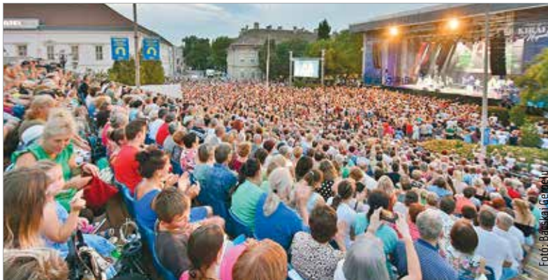
Több ezren voltak kíváncsiak Fenyő Miklós koncertjére