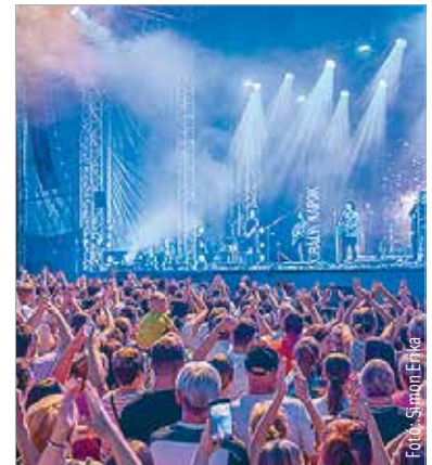
Rengeteg érdeklődőt vonzottak a vasárnap esti programok is a Királyi Napokra