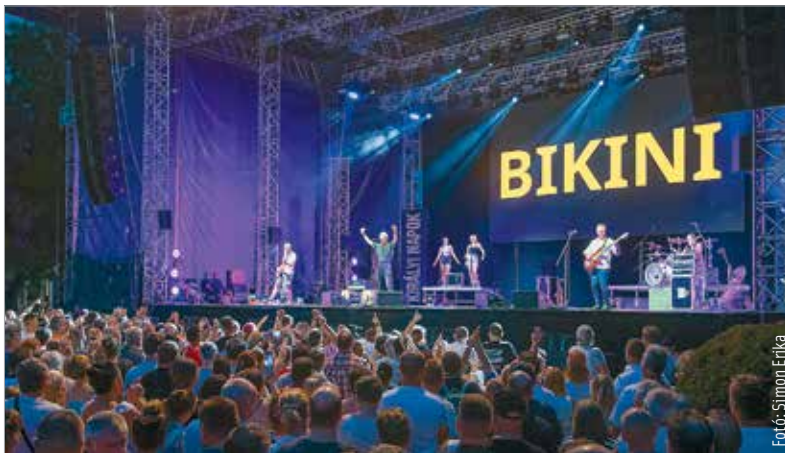
A nyolcvanas évek legendás zenekara ma is rengeteg embert vonz