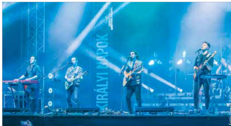
Magyarország egyik legnépszerűbb zenekara zárta a Székesfehérvári Királyi Napok könnyűzenei koncertjeit vasárnap. Zenéjüket nem élvezhettük maradéktalanul, fellépésüket ugyanis a vihar miatt félbe kellett szakítani.