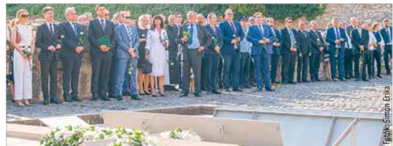
Szent István szarkofágjánál a város és a vármegye vezetői, országgyűlési képviselői, Székesfehérvár és Fejér vármegye közgyűlésének tagjai, továbbá a történelmi egyházak vezetői, a fegyveres, a rendvédelmi és az igazságügyi szervek képviselői helyezték el virágot