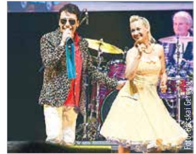
Az énekes a hatvanas évektől a rock&roll első számú és utánozhatatlan nagykövete Magyarországon. Türelmen energiával koncertezik ma is.