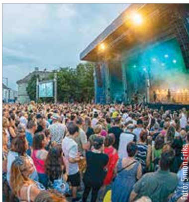
„Látva a ma esti koncert iránti érdeklődést, minden bizonnyal visszahívjuk a Bagossy Brothers Company-t Fehérvárra!” – ígérte a polgármester a vihart követően