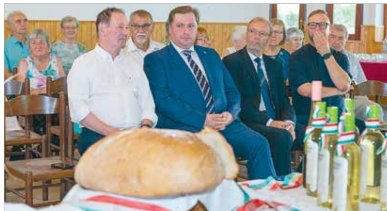
Idén is szép számmal vettek részt a kisfaludiak a délutáni eseményen

Dalkör műsorát követően osztották azt szét a megjelentek között.