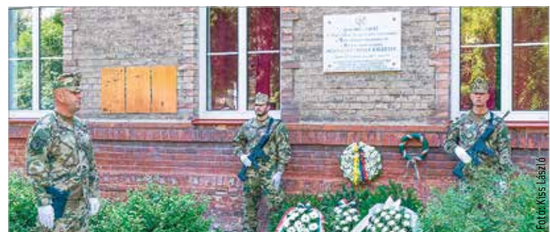
Nyolcvanöt évvel ezelőtt, 1939. augusztus tizenötödikén új csapatzászlót adományozott a koronázóváros háziezredének. Erre az alkalomra, valamint a Magyar Királyi Szent István 3. Gyalogezred doni harcokban elesett katonáira emlékeztek pénteken a Lánczos Kornél Gimnáziumnál elhelyezett emléktáblánál.