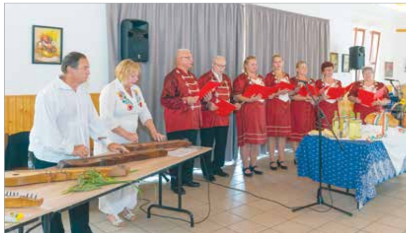
A Búzavirág Dalkör Szent Istvánról szóló énekekkel köszöntötte a Kisfaludi Közösségi Házba érkezőket