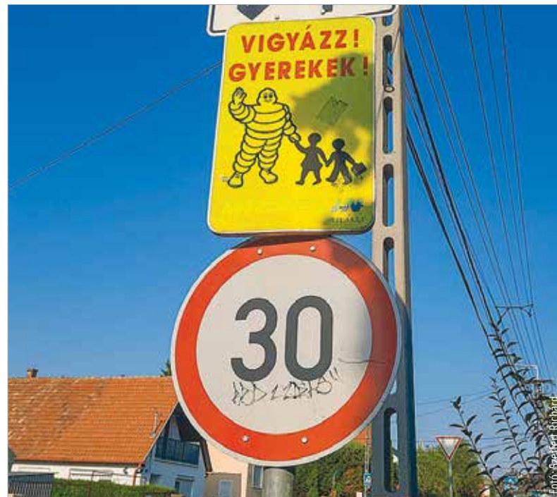
Az autósoknak is fel kell készülni az óvatosabb közlekedésre az intézmények környékén!

Talán ez a legnehezebb feladat reggel, amikor készülődik az egész család. De meg kell próbálni megfelelő időben elrajtolni otthonról, hogy ne kelljen sietni, illetve ha sokan vannak, ne a