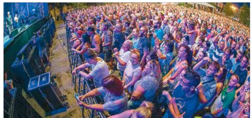
A Bikini szombati fellépése volt az ünnepi programsorozat második, utánozhatatlan hangulatú nagykoncertje