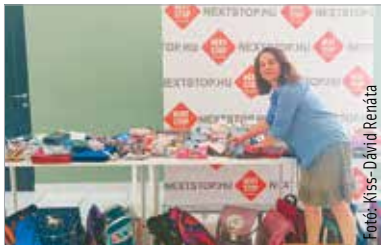
A kezdeményezéshez – a civil összefogáson túl – egy fehérvári vállalat és a MÁV Előre SC ökolívó szakosztálya is csatlakozott

Tolltartók, füzetek, ceruzák, táskák – csak néhány abból a hatalmas adománycsomagból, melyek nemcsak a rászoruló családokhoz kerülnek a tanévkezdésre. A Gondtalan sulikezdés elnevezésű program nyolcadik alkalommal valósult meg. A Next Stop Bevásárlóközpont és az Alba Bástya Család- és Gyermekjóléti Központ közös akciója augusztus tizenkettedikéig tartott, és számos család iskolakezdését teszi könnyebbé. „Legalább ötvenöt-hatvan család biztosan részesül a tanszerekből. Szerdán meg is kezdik kollégáim az adományok kiosztását. Igyekszünk