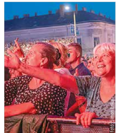
Amíg az időjárás engedte, fergetes volt a hangulat