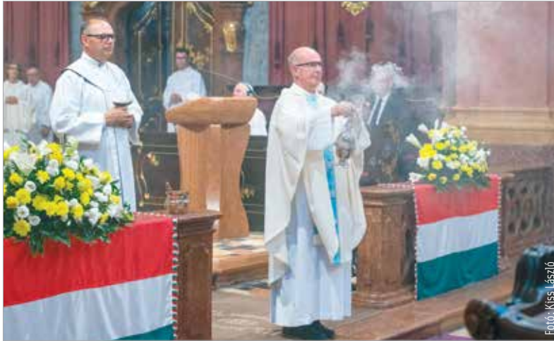
Nagyboldogasszony napja a katolikus egyház legnagyobb Mária-ünnepé

Nagyboldogasszony napján arra emlékeznek a hívó közösség, amikor Máriát halála után Jézus Krisztus föltaaszította és magához emelte a mennyi dicsőségbe. Ezt XII. Piusz pápa 1950. november elsején hittételként hirdette