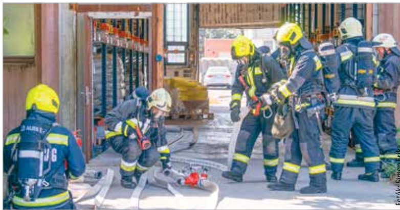
Szerencsére csak szimulációról volt szó, de a katasztrófavédelem felkészültségére éles helyzetben is számíthatunk

Az idei művelet is eligazítással kezdődött a közreműködő szervezetek számára, majd belső tűzvédelmi gyakorlatra került sor a Móraagró Kft. székesfehérvári telephelyén. A lakossági tájékoztató szirénák is megszólaltak, melyek a gyakorlat kezdetét jelezték: „A gyakorlat helyszínén egy veszélyes üzem legveszélyesebb részében elektromos meghibásodás során keletkezett tűz. Az üzem dolgozói megkezdték a