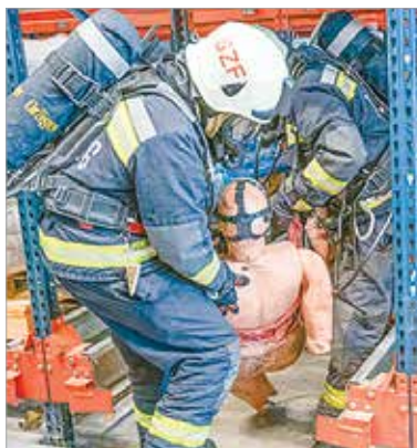
Nemcsak a tűzoltás, adott esetben az emberéletek mentése is a feladatok közé tartozik rendkívüli helyzetben