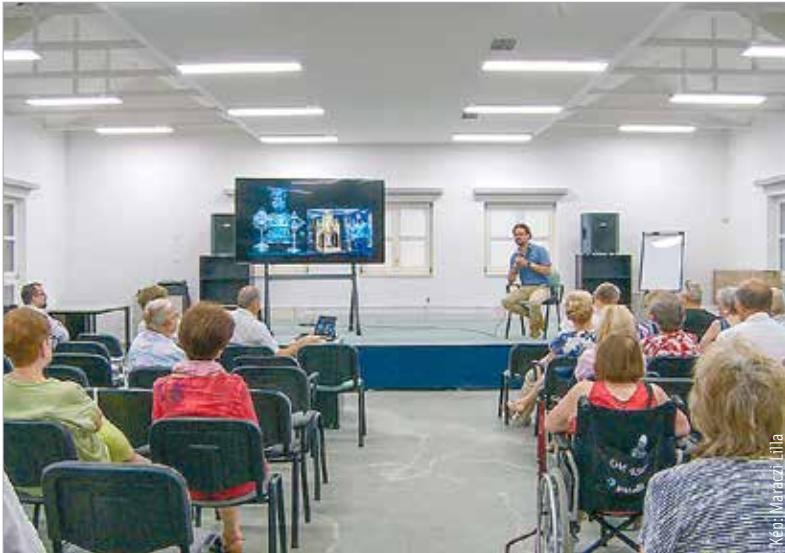
A játékonysági esten ezúttal is a Mozgássérültek Viktória Rehabilitációs Alapítványt támogathatták a résztvevők