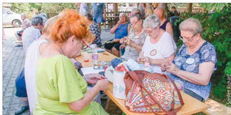
Képf: Szeifert Róbert

A Baptista Egyházi Szociális Módszertani Központ idén is megrendezte a Cédrus Alkotói Táborát. A bentlakásos tábor augusztus huszonhatodikától öt napon át a Seregélyes melletti Elzamajorpusztán, a Pelikánház Erdei Iskolában rendezték meg. Azokat a hatvanöt év felettieket várták, akik baptista fenntartású szociális szolgáltatást vesznek igénybe, illetve valamelyik baptista gyülekezetbe tartoznak, és egyben valamilyen művészeti ágban alkotnak V. L.