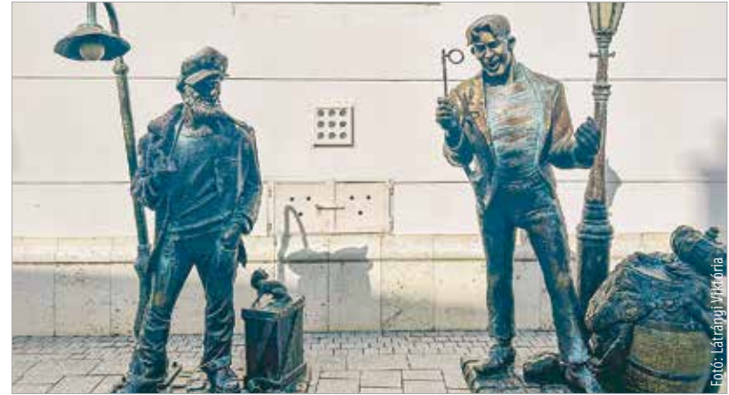
„Kavarja ez itt most a dolgokat, vagy nem kavarja?”

nyeiben sikerült igazán jól visszaadni a figurák karakterét, humorát és Rejtő zseniális történeteit. A most fehérváron látható szobrokban felismerhetők a legendás Rejtő-képregények alakjai. Piszkos Fred és Fülig Jimmy délelőtt tíz és este hat között látható, éjszakára ugyanis a múzeumba „költöznek” hőseink. A szervezők a regények szereplőihez kapcsolható idézetekkel, Rejtő Jenő életútjának ismertetésével teszik élővé a bemutatót. A kísérőprogramokat szombaton könyvbemutató zárja.