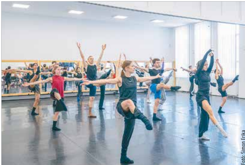
A nyílt nap résztvevői megismerkedhettek egy interaktív balettyakorlat próbájával, illetve megtekinthették egy részletet a szeptemberben bemutatásra kerülő Pinokkió című produkcióból

A társulat igazgatója ezt követően értékelte az elmúlt év történéseit, bemutatta az újonnan leszerződött művészeket, majd beszélt az idei év darabjairól. Az új évadban a Vörösmarty Színházban négy bemutatót tekinthetnek meg a műfaj barátai: színre kerül a Pinokkió, a Fantomfájdalom, a Kövek és a Diótörő.