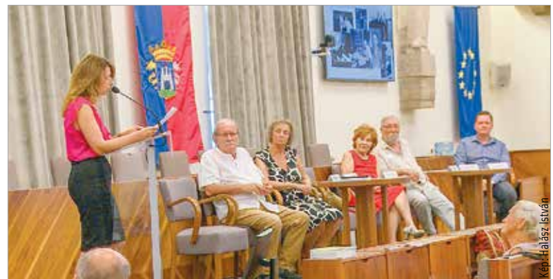
A költő, író, műfordító életművét a versek mellett prózai alkotásainak gazdag sora – társadalmi és történelmi regények, háborús napló, memoár, népszerű irodalomtörténet és műfordítások – teszik teljessé