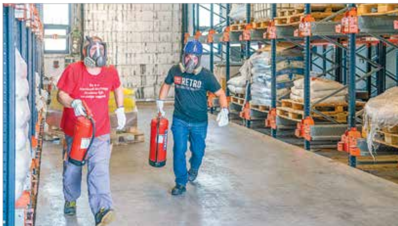
A veszélyes anyagokkal dolgozó üzemben vészhelyzet esetén mindenkinek azonnal fel kell vennie a gázmaszkot

veszély elsődleges elhárítását, közben értesítették a katasztrófavédelem egységeit. Végül a tűzoltók kiérkeztek,