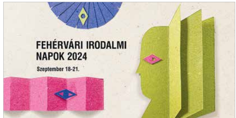
A Fehérvári Irodalmi Napok rendezvénysorozata nemcsak irodalmi élményeket kínál!