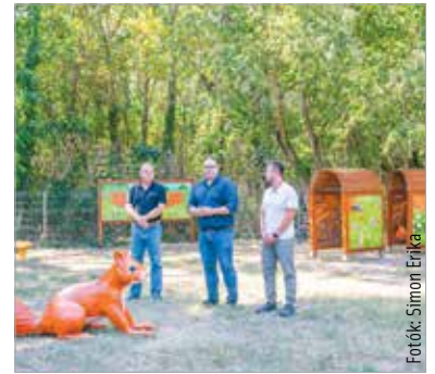
A Sóstó Vadvédelmi Központban zárult Székesfehérvár eddigi legnagyobb rehabilitációs projektje