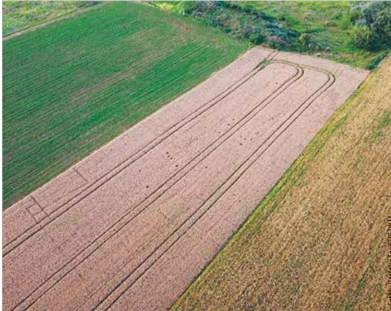
A búzamezőben a traktornyomok közötti halvány vonalak jelzik a római épületek helyét