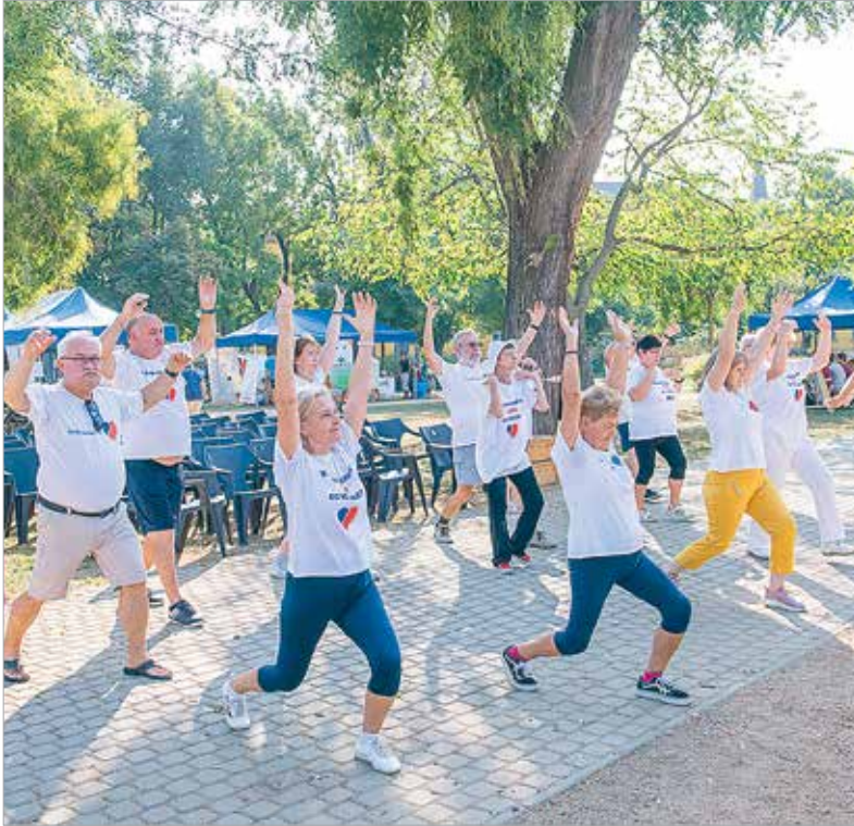
Az egész napos programokat a Fehérvári Szívgyógyászati Társaság bemelegítő tornájával indították el

így többek között az érdeklődők találkozhattak az állatotthonok fenntartóival, a harcművészetek képviselőivel, a családsegítő szervezetekkel és a testi-lelki egészséget őrző csoportokkal. A Civilnap célja – amellett, hogy megmutassa a fehérváriaknak, milyen szervezetek működnek városunkban – az, hogy a jelenlévő csoportok kapcsolatokat építhessenek egymással. Ez a több mint