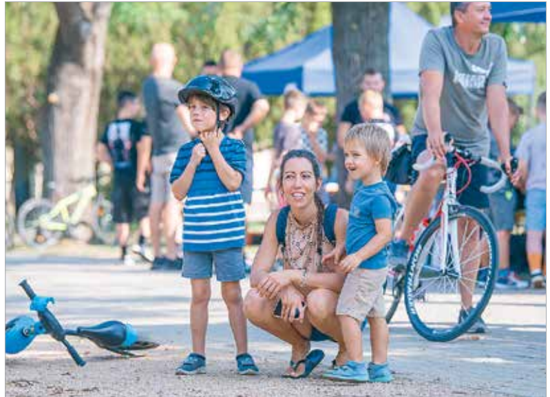
A rendezvény évről évre egyre népszerűbb a családok körében is