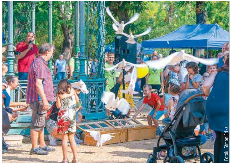
A kislátványosított mosolyt csaltak a gyerekek arcára