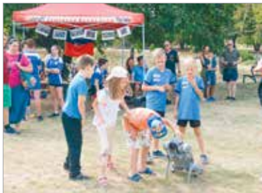
A honvédség robotkutyájával is találkozhatnak a gyerekek

Az egész napos ingyenes programon a gyerekek székesfehérvári egyesületek jóvoltából ismerkedhettek meg a sportágakkal, valamint számos katonai hagyományörző csoport mutatta be a különböző korok hadviseelését.