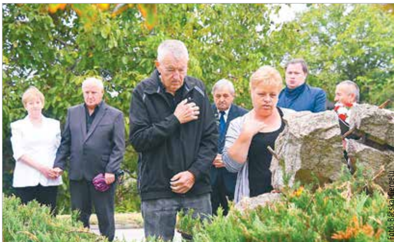
Az áldozatok hozzátartozói minden évben szeptember kilencedikén 11 óra 55 perckor emlékeznek elvesztett szeretteikre