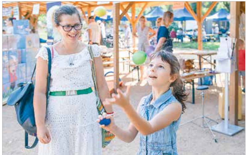
Zeneszó, ügyességi játékok, küzdősport-bemutató és gyermekeknek szóló koncert is várta a Zichy ligetbe érkezőket