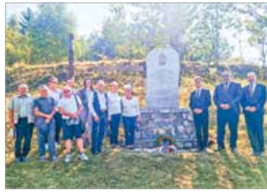
A gyergyóiak évtizedek óta gondozzák a fehérvári hősök sírjait