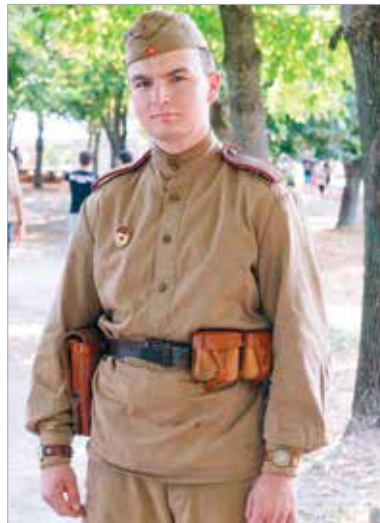
A Honvéd Szondi SE, az iGenerációért Egyesület és a Fiatal Civil Kurázi Egyesület a katonai hagyományokra és a sportra helyezte a hangsúlyt

mányörző csoport mutatta be a különböző korok hadviseelését.