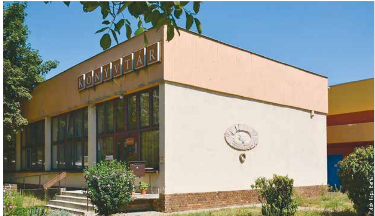
Az alkotás kiváló állapotban van, méltó emléket állítva a fehérvári születésű Jankovich Ferencnek

A mű ihletője, Jankovich Ferenc Kossuth-, József Attila- és Baumgarten-díjas magyar költő, író, műfordító 1907. november 29-én született Székesfehérváron.