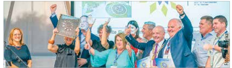
A csapatoknak volt okuk az öröme!