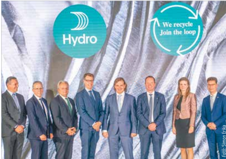
Ünnepélyes keretek között avatták fel a Hydro új üzemét, mely nyolcvan új munkahelyet is jelent

A megnyitón többek között Cser-Palkovics András, Székesfehérvár polgármestere is beszédet mondott. Úgy fogalmazott, hogy ünnep ez a nap a Hydrónak, a magyar gazdaságnak és Székesfehérvárnak egyaránt: „Ez nemcsak egy ipari üzem, hanem a körforgásos gazdaság egyik alapja, egy környezetvédelmi fejlesztés és beruházás: visszaforgatják az alumíniumot, és így állítanak elő új terméket. Tehát úgy vigyázunk a földre, a környezetünkre, hogy közben komoly ipari teljesítményt nyújtanak az itt dolgozók!” A kormány jelentős támogatásával létrejött üzem nyolcvan munkahelyet teremt. A Nemzeti Befektetési Ügynökség hatmillió euróval járult hozzá az üzem megépítéséhez, és tizenhét milliós adókedvezményt is élvezhet a cég. A fejlesztéssel egy világszínvonalú létesítmény jött létre, mely Európa egyik legnagyobb és legmodernebb üzeme.