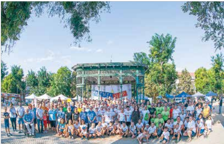
A rendezvény nemcsak seregszemléje a helyi közösségeknek, de lehetőséget teremt arra is, hogy a civilek egymással is erősítsék az együttműködést

ötven szervezet önmagában is mutatja a civilközösség erejét – mondta el Cser-Palkovics András polgármester.