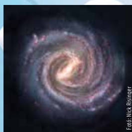
2024. szeptember 12-18.

Az életben vannak dolgok, amiket nem tudsz befolyásolni. Inkább pihenj és töltődj fel, főleg, ha karrierambíciókkal, álláskereséssel vagy különleges projektekkel szeretnél foglalkozni. Eljött az ideje, hogy ismét személyes céljaidra összpontosíts!