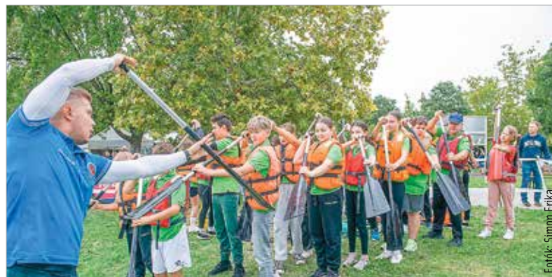
Vizre szállás előtt avatott szakemberek ismertették meg a legfontosabb mozdulatokkal és tudnivalókkal a diákokat