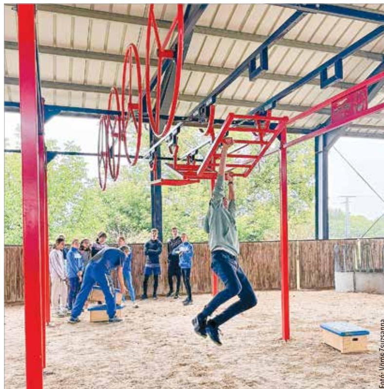
Nyílt napot tartott szombaton a Volán Fehérvár öttusaszkosztálya. Az érdeklődő gyerekek a vívóteremben éppúgy kipróbálhatták a sportág kellekeit, ahogy a legújabb számmal, az akadálypályával is megismerkedhettek. A párizsi volt az utolsó olimpia, amelyen a lovaslás szerepelt az öttusa programjában, ezentúl az OCR, vagyis gyorsasági akadálypálya kerül be az úszás, a vívás és a lézer run, azaz a futás-lövészet mellé. A szakosztály edzői várták a gyerekeket, akik játékos formában találkozhattak a Fehérváron nagy hagyománnyal rendelkező öttusával.