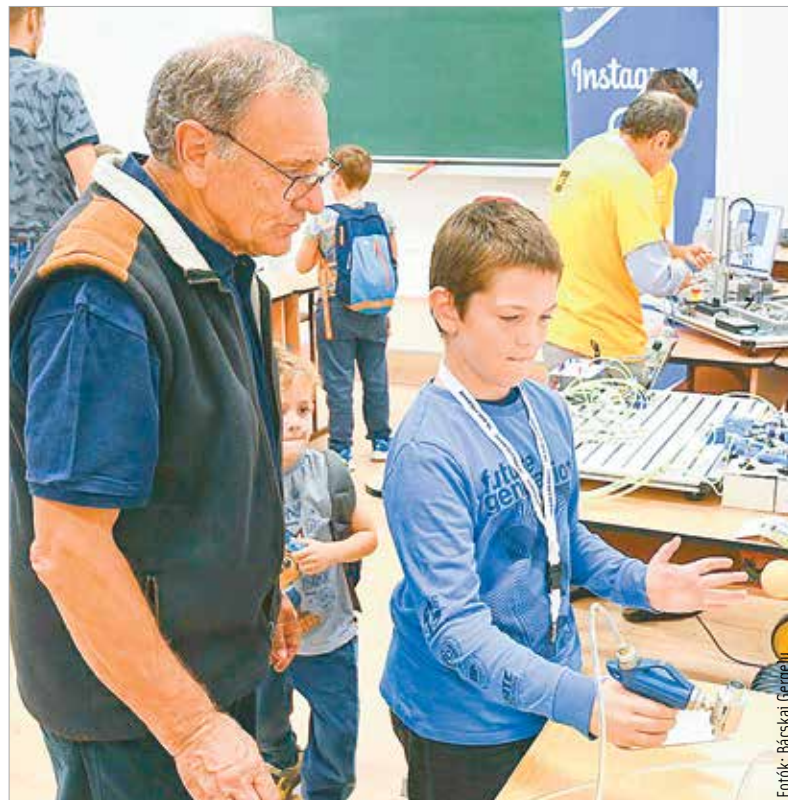
A fiatalabb korosztályt interaktív kiállításokkal, bemutatókkal lehet megszólítani