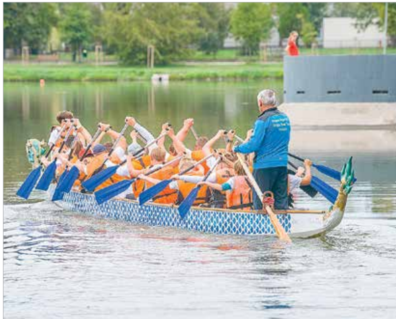
Az Európai Diáksport Napján szervezték meg a Kisdiák Vegyes Kupát és a Nebuló Kupa versenyt is

Ismét megrendezték a hagyományos sárkányhajó-fesztivált a Csónakázó-tavon. Pénteken és szombaton általános iskolások, egyetemisták és felnőtt amatőr csapatok is összemérhették tudásukat, illetve megismerkedhettek a csapatépítésre is kiválóan alkalmas sportággal.