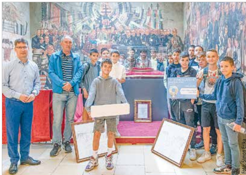
Jó helyre kerültek az ajándékok!

Az iskolásokra ebben az évben is izgalmas feladatok vártak: vetélkedőkön, bemutatókon keresztül ismerkedtek meg a fenntarthatósággal és a közösségi közlekedés szabályaival. A fiatalok mellett megismerhették és megérthették, miként működik a város, mi mindent kell tenni a hétköznapokon azért, hogy igazi ünnepeink legyenek.