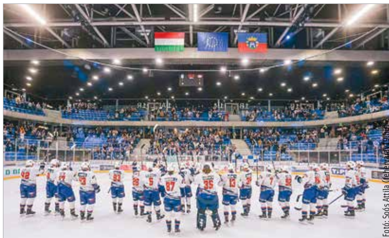
Amit még sokszor szeretnénk látni: győzelmi ünnep az Alba Arénában