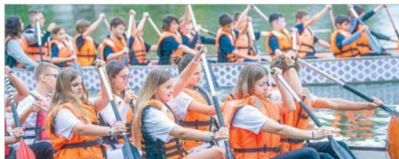
Az összhang rendkívül fontos a sárkányhajózásban, ezért is tartják közösségépítő tevékenységnek a sportágot