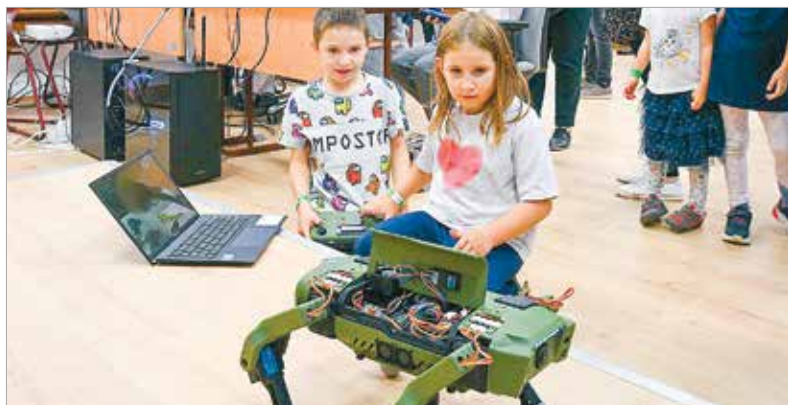
Howy mindig, idén is a robotok varázsolták el legjobban a gyerekeket

Az udvaron pedig egy imitált bűntett helyszínén hívták segítségül a technikát, és mutatták meg, hogyan használják a drónokat e területen. De volt rókavadászat, kincskeresés és többféle kísérlet is.