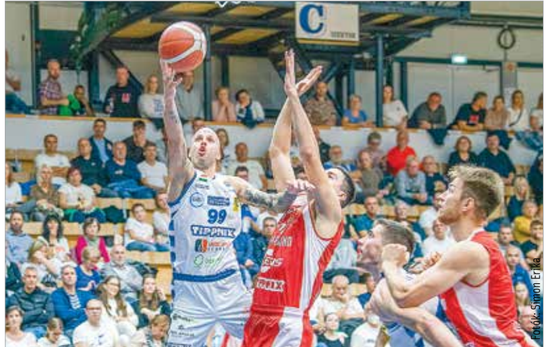
Vojvoda tizenkilenc ponttal keserítette a kőrmendiek életét a bajnoki rajton

vebkek a kereteik, de a most látott játékkal felveheti velük a versenyt a Fehérvár.