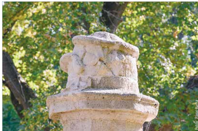
Tekerő kígyó a felső díszítés

Sajnos az emlékoszlop alkotója ismeretlen, az azonban biztos, hogy az alul legyezőelemmel, felül tekergőző kígyóval díszített oszlop eredeti felirata ez volt: „E hely