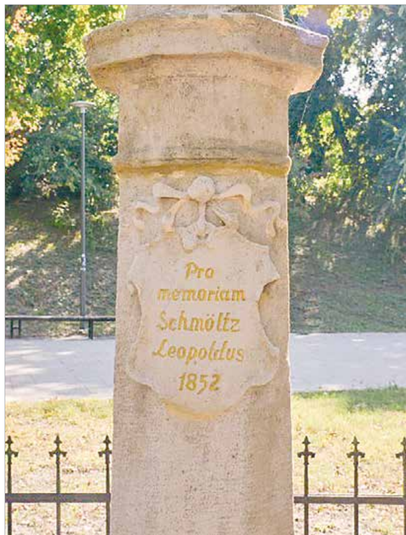
A jelenlegi felirat

és ekkor került áthelyezésre a katolikus temető előtti ligetszerű területre. Ekkor került rá az oszlopon levő táblára a mostani felirat: Pro memoriam Schmöltz