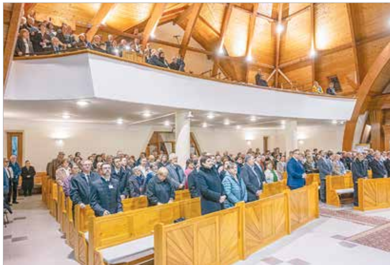
Megtelt a Budai úti templom az ünnepi istentiszteletre