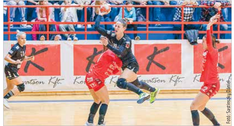
Smbatian arcáról leolvasható, mennyire kemény meccset játszott a Debrecennel az Alba

Így volt a jóval erősebb Debrecen ellen is, aminek köszönhetően az első féléjében végig tapadt ellenfelére az Alba. Szünet után aztán megmutatták a vendégek, mitől számítanak a nemzetközi kupában edződvé favoritnak a fehérváriak ellen, és egy 9-2-es periódussal eldöntötték a meccset. Amelyen nem volt hiány kőkemény ütközésekben, tényleg nem adta olcsón a bőrét az Alba. Szombaton a táblázaton utolsó előtti Vasas otthonába látogat a jelenleg tizenegyedik helyen álló Fehérvár, egy hétre rá pedig hazai pályán fogadja a kupában bravúrral búcsúztatott Esztergomot.