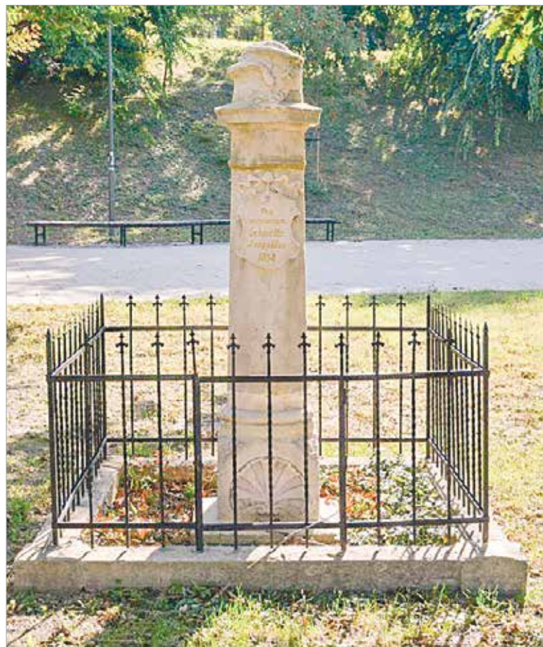
Tavaly óta újra jó állapotban van az emlékoszlop

a kilencvenes években került át mai helyére. A Köztérkép erről így ír: „Az emlékoszlop eredetileg a sóstói stadion területén állt, a Városszépítő- és védő Egyesület 1993-94-ben helyreállította,