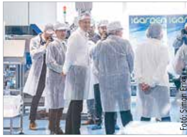
Az egészségiparban lép előre a Karsai Alba Kft.

Cser-Palkovics András polgármester beszédében kiemelte, hogy Székesfehérvár hazánk egyik gazdasági erőcentruma, az pedig, hogy most egy magyar családi vállalkozás erősödik tovább, a közösséget is erősíti: